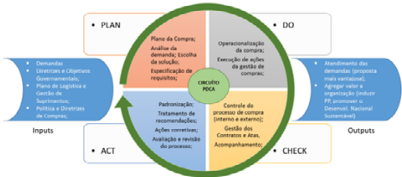
Figura 2: Ciclo de gestão de compras públicas

O entendimento sobre as dimensões que abarcam este ciclo favorece um pensamento sistêmico e integrado sobre o processo e a atividade de compras governamentais. A Figura 2 a seguir resume esta abordagem.