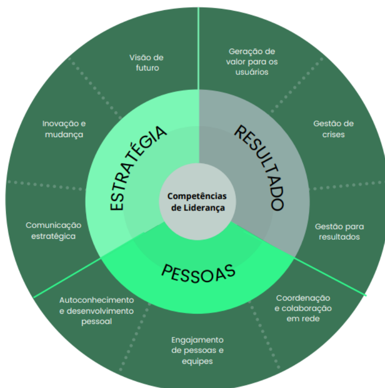
Figura 2 - Competências essenciais de liderança para o setor público

Foram, portanto, estabelecidas nove competências essenciais de liderança, distribuídas em três eixos, conforme Figura 2.